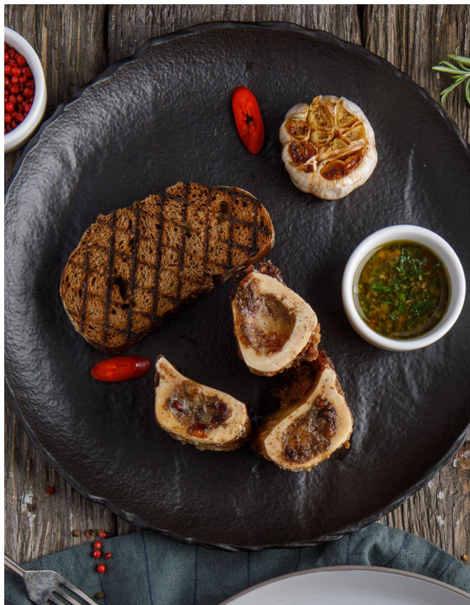
МОЗГОВЫЕ КОСТИ | MARROW BONES с соусом чимечури | WITH CHIMICHURRI SAUCE | 750 ₺