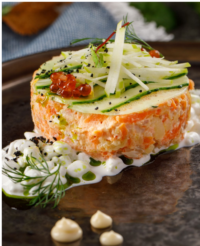
САЛАТ ИЗ ФОРЕЛИ И СИГА Г/К