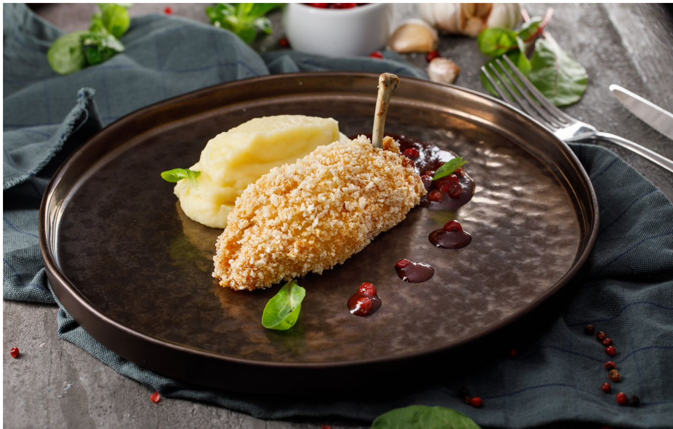
КОТЛЕТА ПО-КИЕВСКИ подаётся с картофельным пюре

CHICKEN KIEV SERVED with mashed potatoes