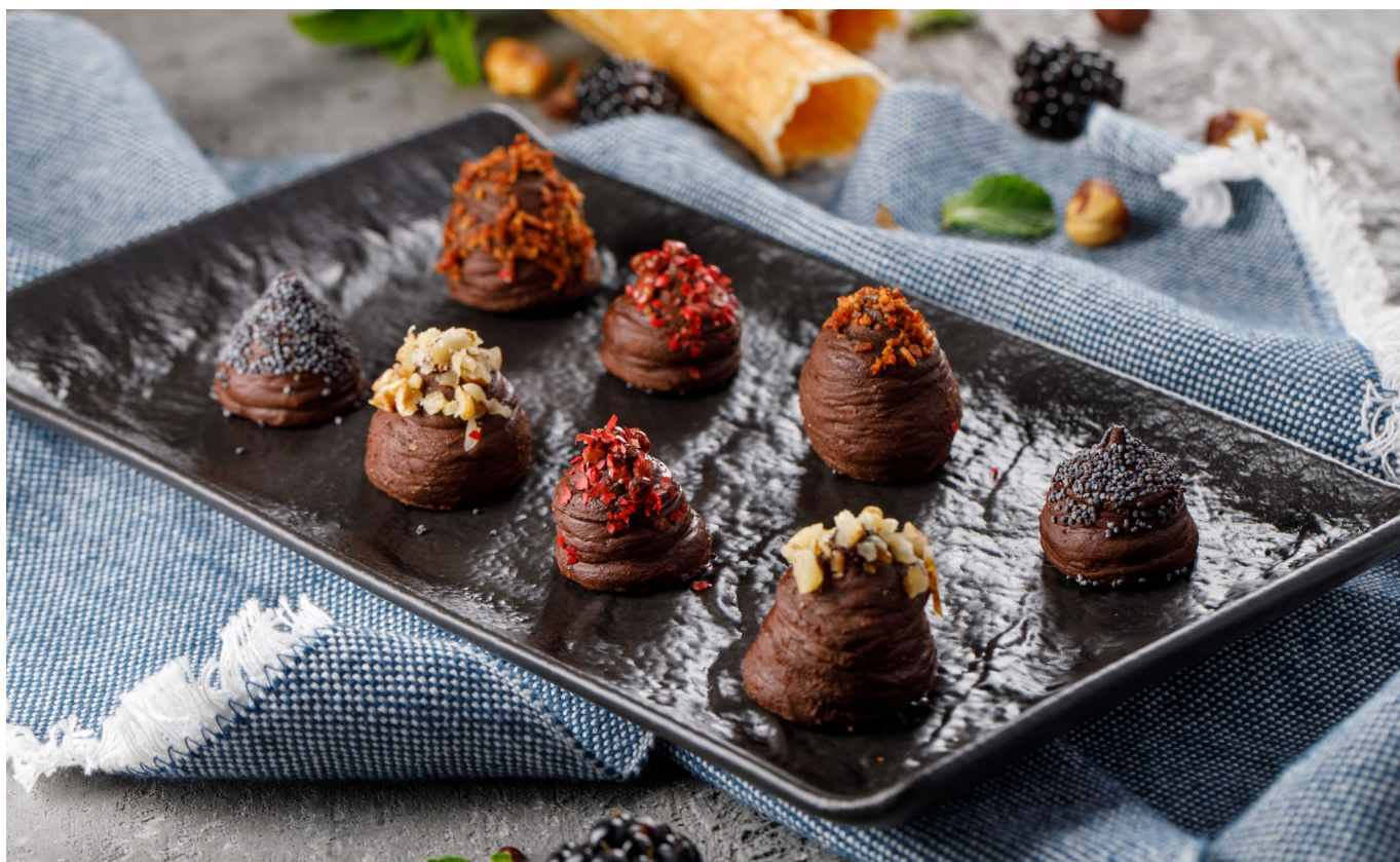
ШОКОЛАДНЫЕ КОНФЕТЫ, 1 ШТ. с красным перцем и розмарином, с маком, с беконом и сыром дор блю, грецкий орех и сыр дор блю

ASSORTED CHOCOLATS, 1 PC with red pepper and rosemary, with poppy seeds, with ba- con and dor-blue cheese, with dor-blue cheese and walnuts