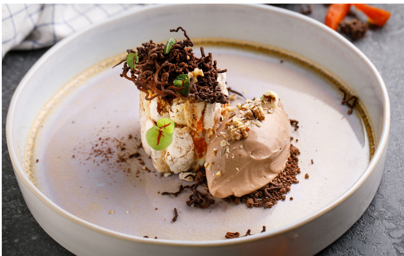
РУЛЕТ ИЗ МЕРЕНГИ С ШОКОЛАДНЫМ МУССОМ