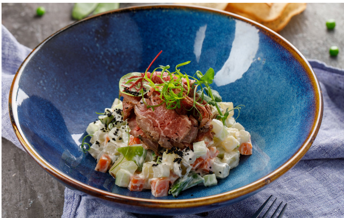
ОЛИВЬЕ С ФЕРМЕРСКОЙ ГОВЯДИНОЙ