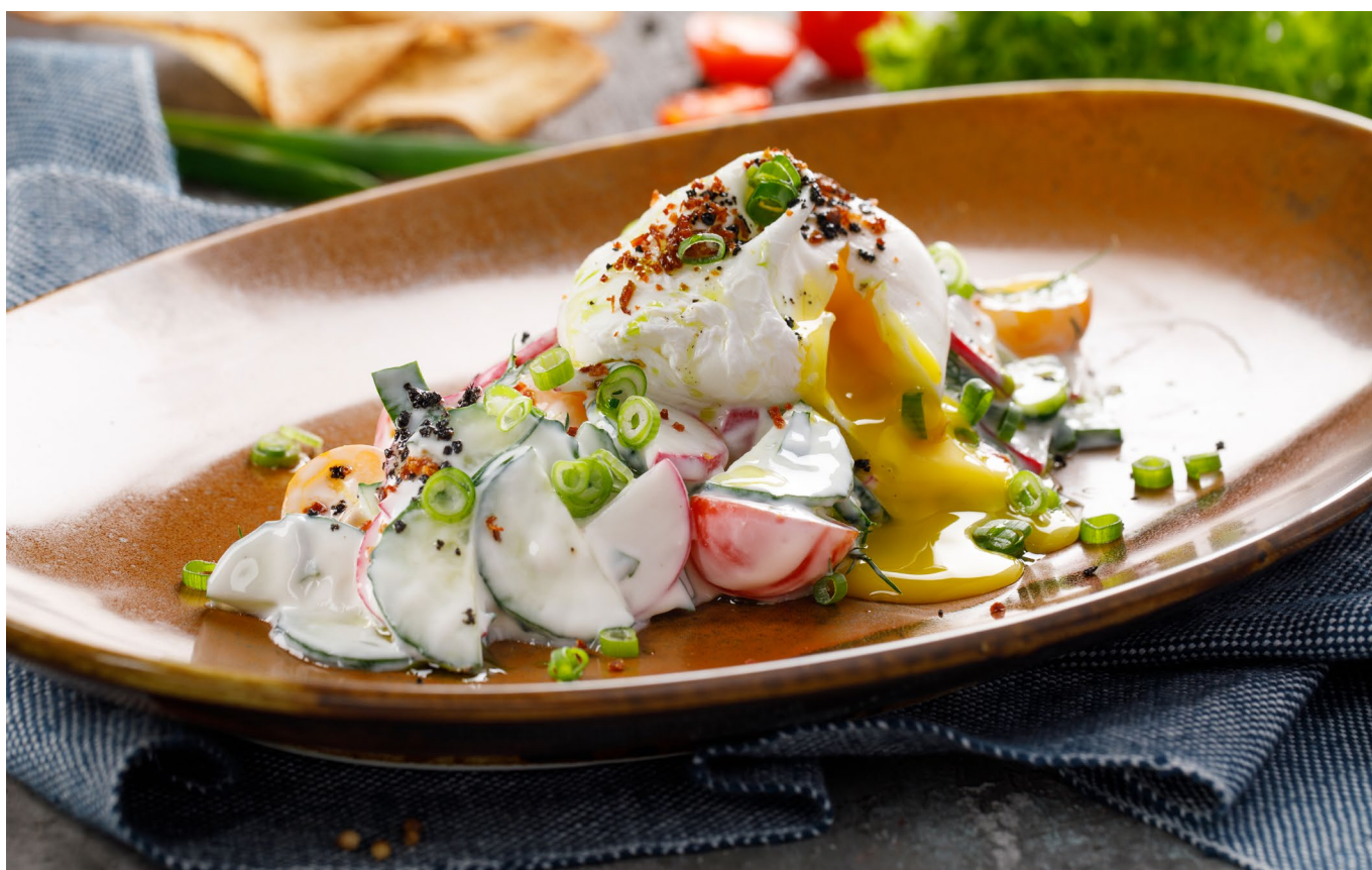
САЛАТ ДЕРЕВЕНСКИЙ С ДОМАШНИМ ЙОГУРТОМ И ЯЙЦОМ ПАШОТ