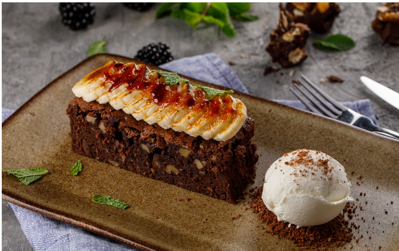
БРАУНИ С КАРАМЕЛИЗОВАННЫМ БАНАНОМ И ШАРИКОМ МОРОЖЕНОГО