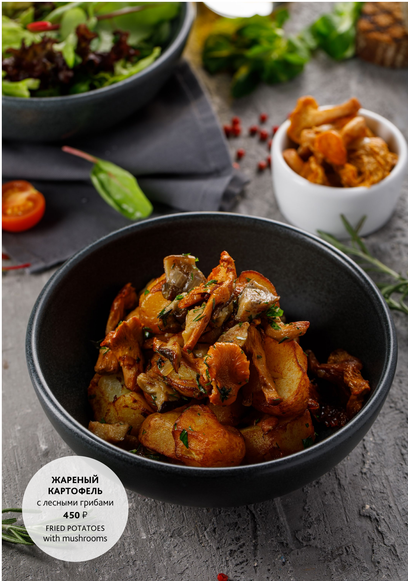
ЖАРЕНый КАРТОФЕЛЬ с лесными грибами 450 ₺ FRIED POTATOES with mushrooms

ПРОСЬБА ПРЕДУПРЕЖДАТЬ ВАШЕГО ОФИЦИАНТА ОБ ИМЕЮЩЕЙСЯ У ВАС АЛЛЕРГИИ НА ОПРЕДЕЛЕННЫЕ ПРОДУКТЫ ПИТАНИЯ. PLEASE TELL YOUR WAITER IF YOU HAVE ANY FOOD ALLERGY. ПОДАЧА НА ФОТОГРАФИЯХ МОЖЕТ ОТЛИЧАТЬСЯ. SERVED DISH MAY LOOK DIFFERENTLY IN THE PICTURE.