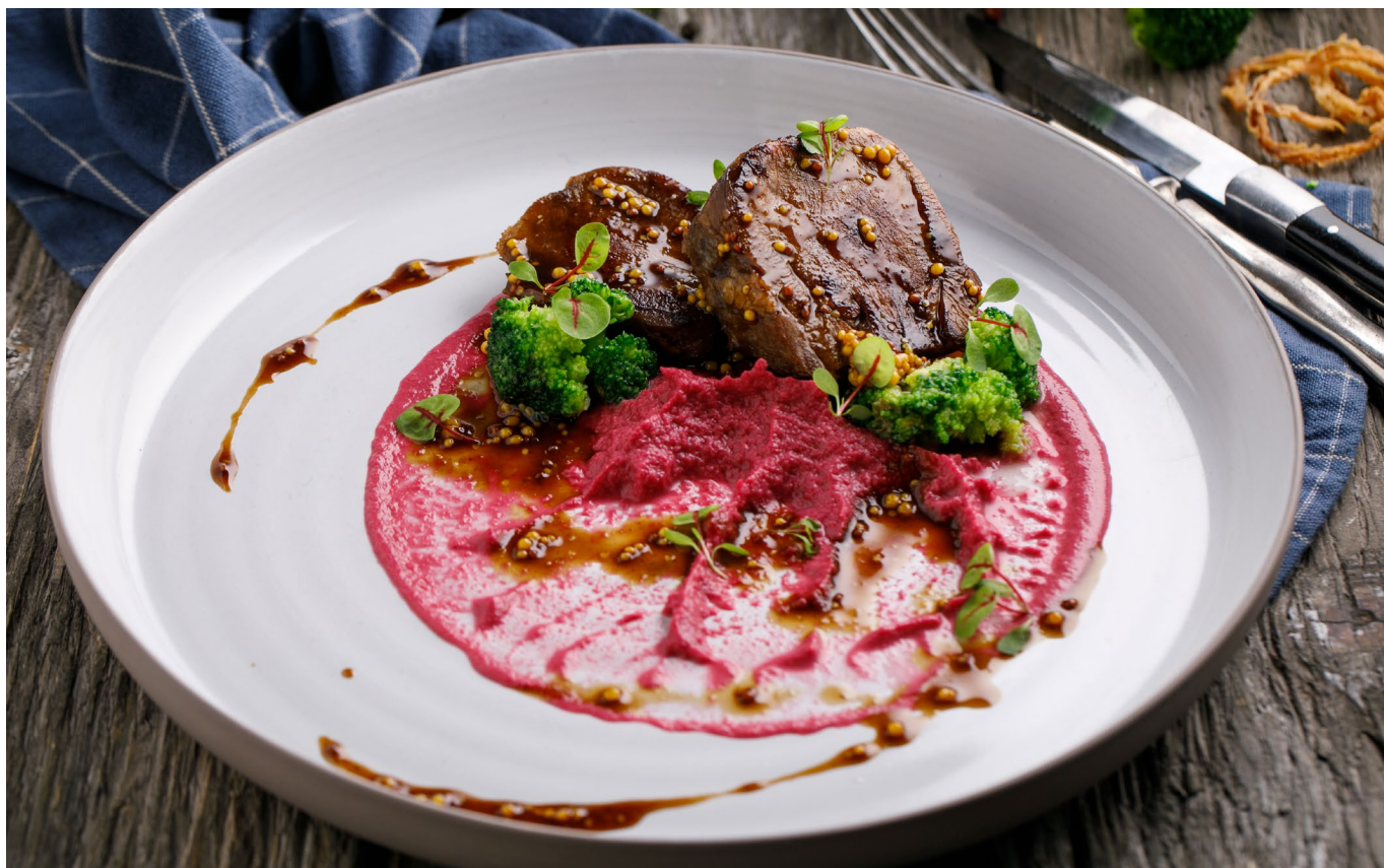
ТОМЛЕННЫЙ ГОВЯЖИЙ ЯЗЫК | STEWED BEEF TONGUE WITH RED С ПЮРЕ ИЗ КРАСНОЙ КАПУСТЫ | CABBAGE PUREE | 1340 ₺

ПРОСЬБА ПРЕДУПРЕЖДАТЬ ВАШЕГО ОФИЦИАНТА ОБ ИМЕЮЩЕЙСЯ У ВАС АЛЛЕРГИИ НА ОПРЕДЕЛЕННЫЕ ПРОДУКТЫ ПИТАНИЯ. PLEASE TELL YOUR WAITER IF YOU HAVE ANY FOOD ALLERGY. ПОДАЧА НА ФОТОГРАФИЯХ МОЖЕТ ОТЛИЧАТЬСЯ. SERVED DISH MAY LOOK DIFFERENTLY IN THE PICTURE.