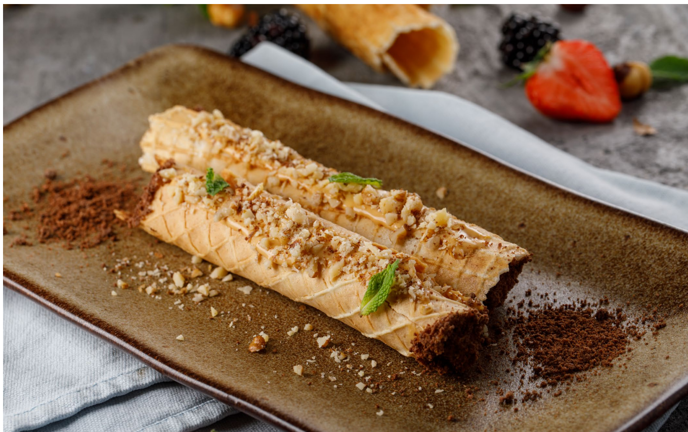
ХРУСТЯЩАЯ ТРУБОЧКА С ВАРЕНОЙ СГУЩЕННОЙ И ОРЕХАМИ

CRISPY WAFER ROLLS WITH CARAMELIZED MILK AND NUTS