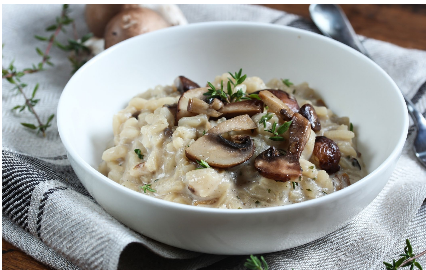
РИЗОТТО С БЕЛЫМИ ГРИБАМИ