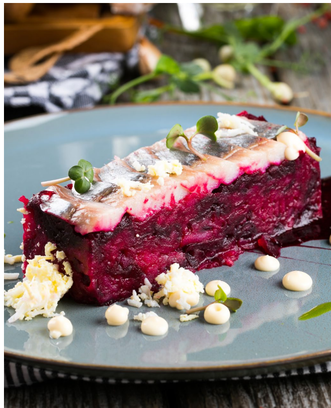
АВТОРСКАЯ «СЕЛЬДЬ ПОД ШУБОЙ»