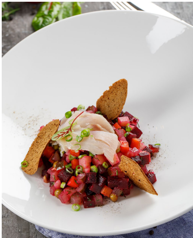
ДОМАШНИЙ ВИНЕГРЕТ С СИГОМ Х/К

HOMEMADE VEGETABLE SALAD WITH SMOKE-DRIED CISCO