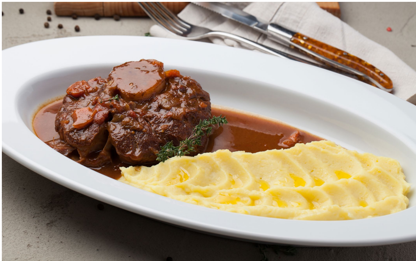
ОССОБУКО С КАРТОФЕЛЬНЫМ ПЮРЕ