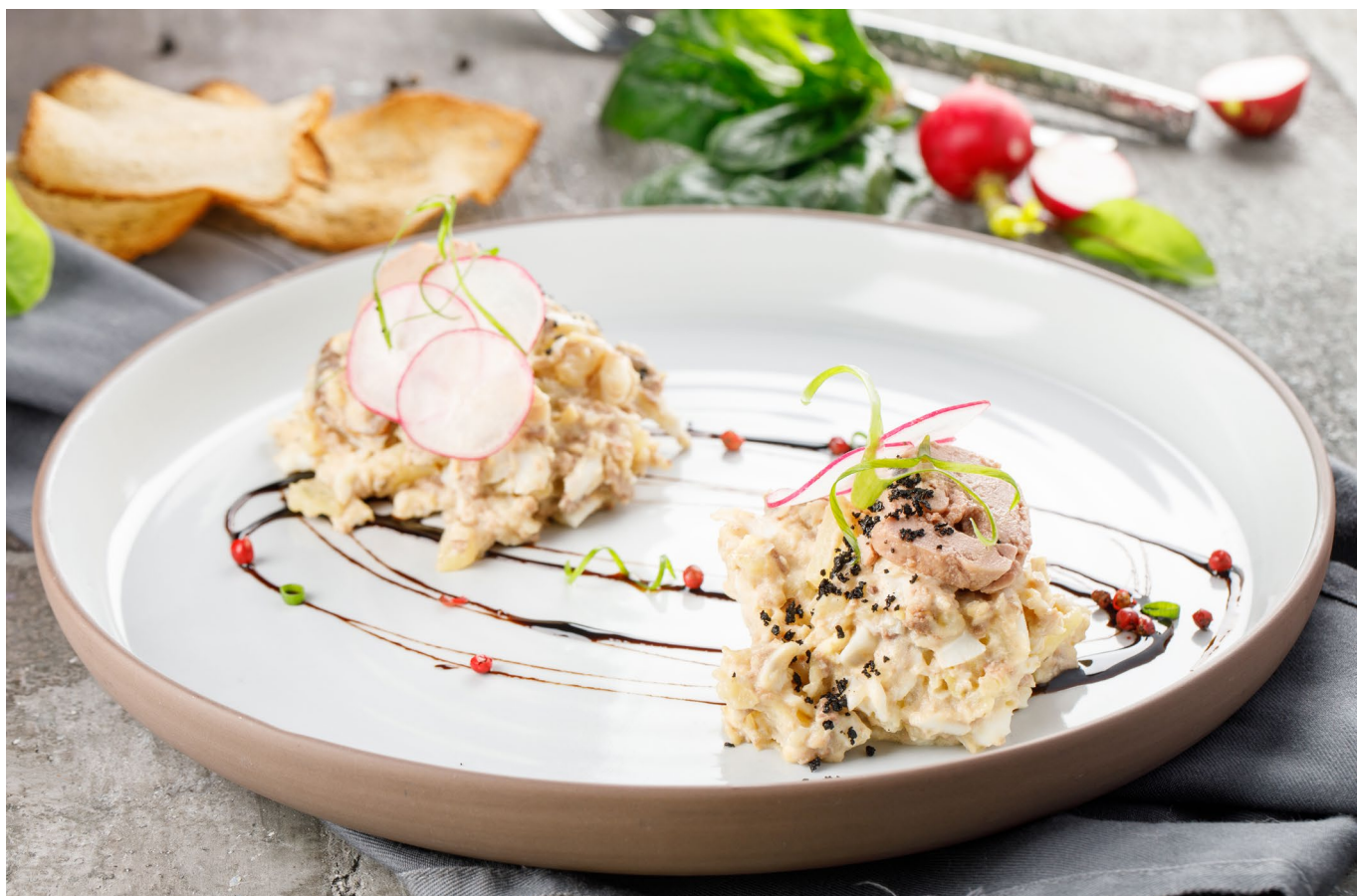
САЛАТ С ПЕЧЕНЬЮ ТРЕСКИ