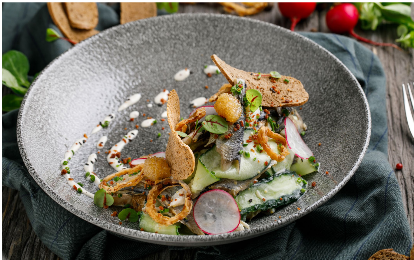
САЛАТ ИЗ ПОДКОПЧЕННОЙ РЯПУШКИ И МОЛОДЫМ КАРТОФЕЛЕМ