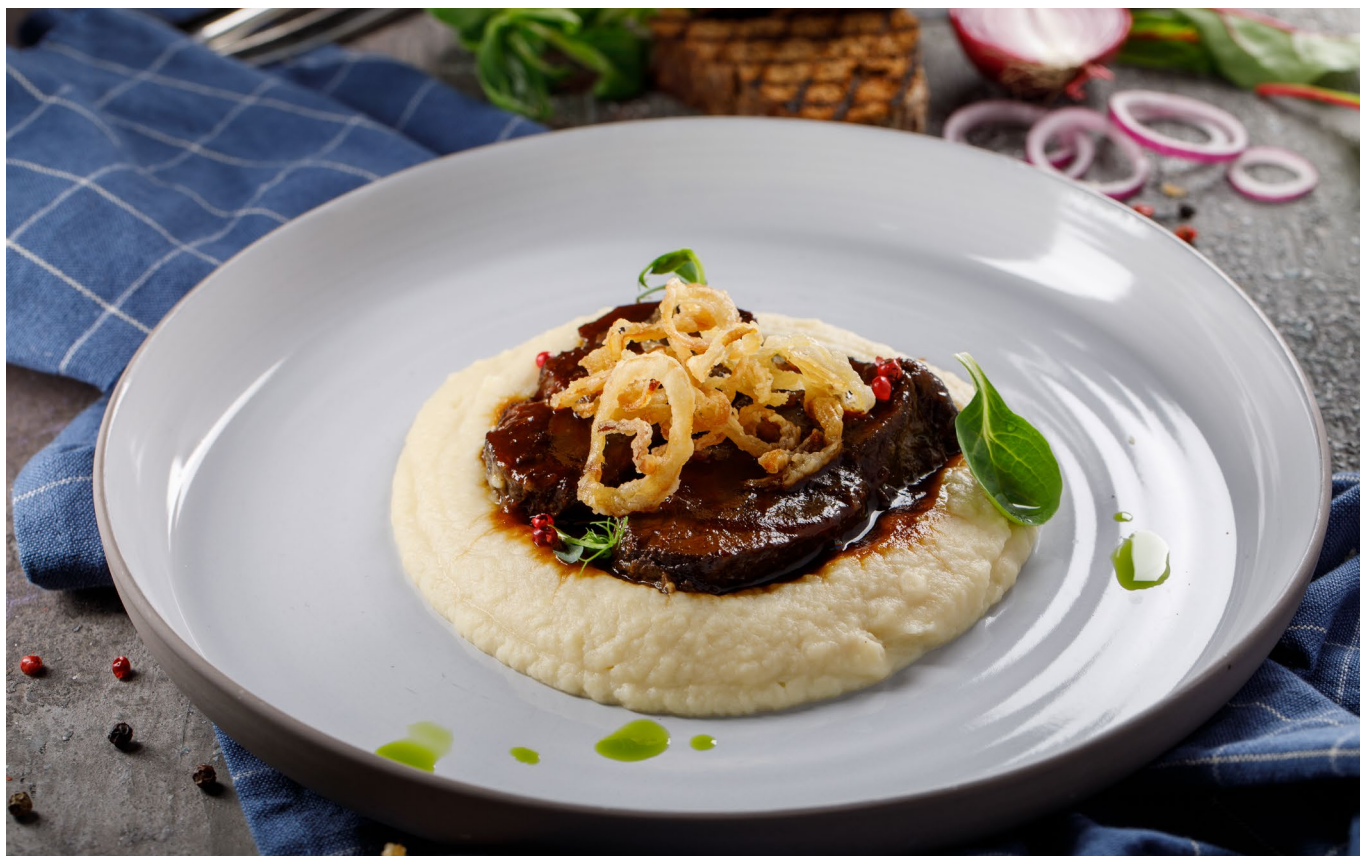
ТЕЛЯЧЬИ ЩЕЧКИ С СЕЛЬДЕРЕЕВЫМ ПЮРЕ