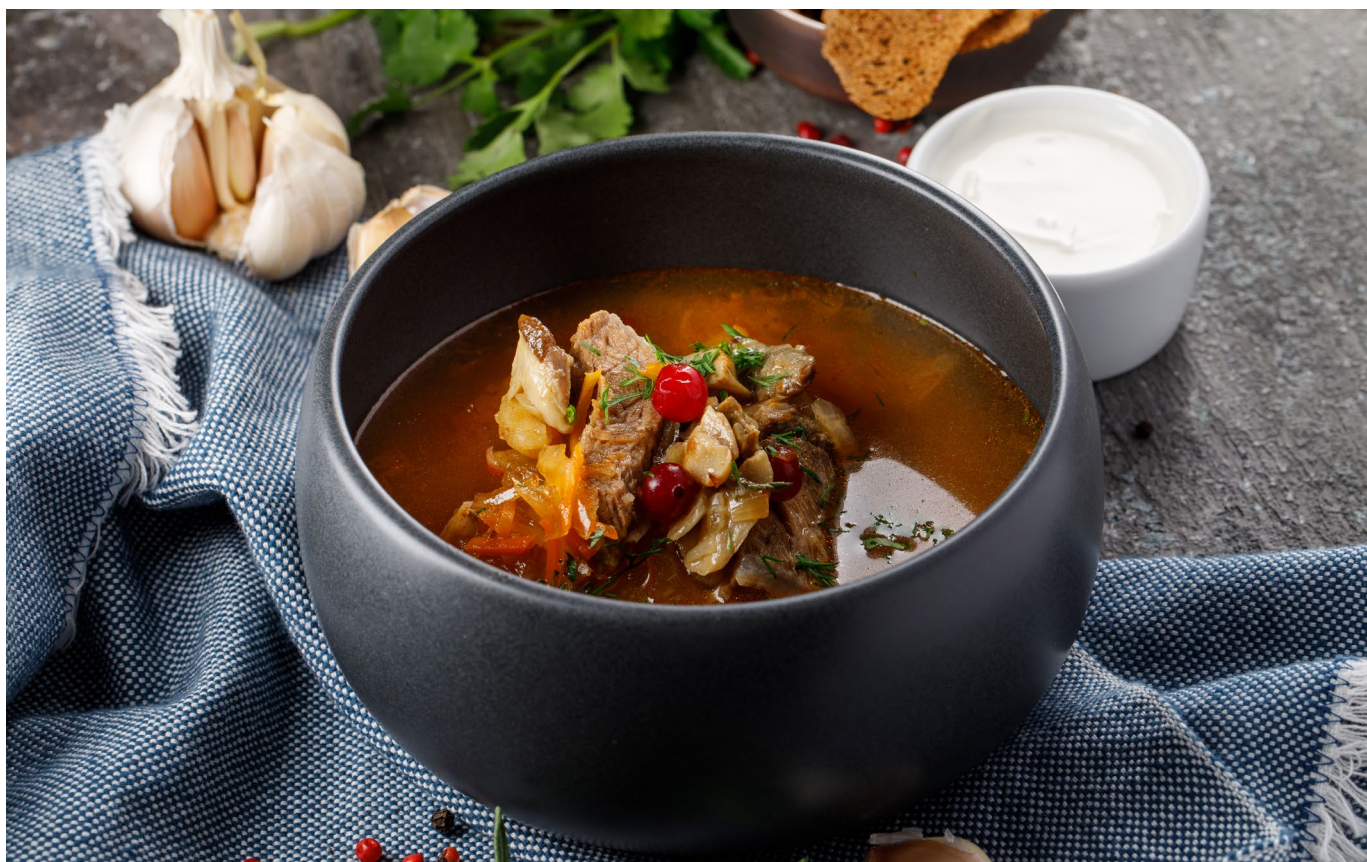
ЩИ КИСЛЫЕ С КЛЮКВОЙ, БЕЛЫМИ ГРИБАМИ И ДЕРЕВЕНСКОЙ СМЕТАНОЙ

RUSSIAN CABBAGE SOUP WITH CRANBERRY AND PORCINI