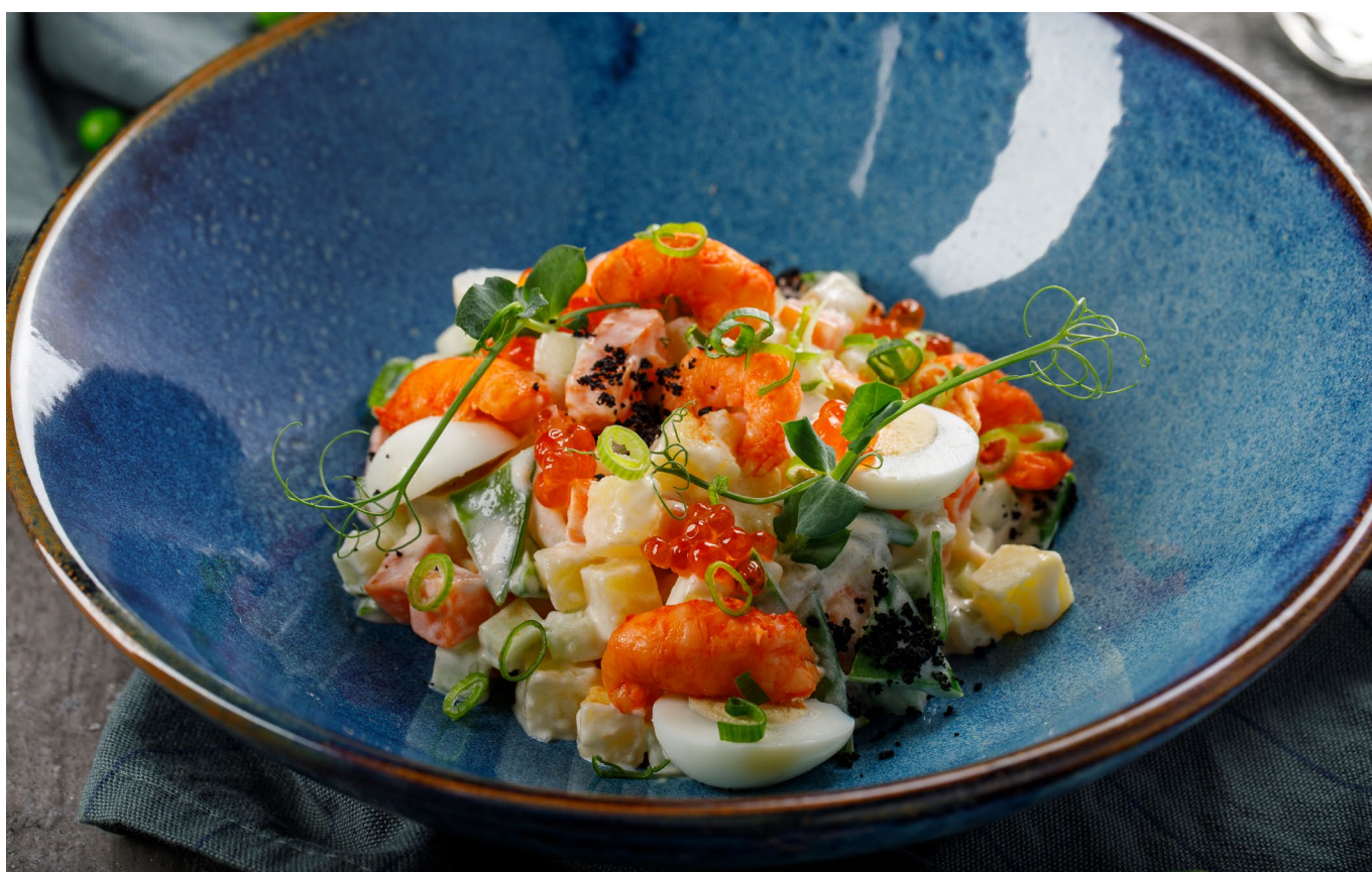
ОЛИВЬЕ С РАКОВЫМИ ШЕЙКАМИ