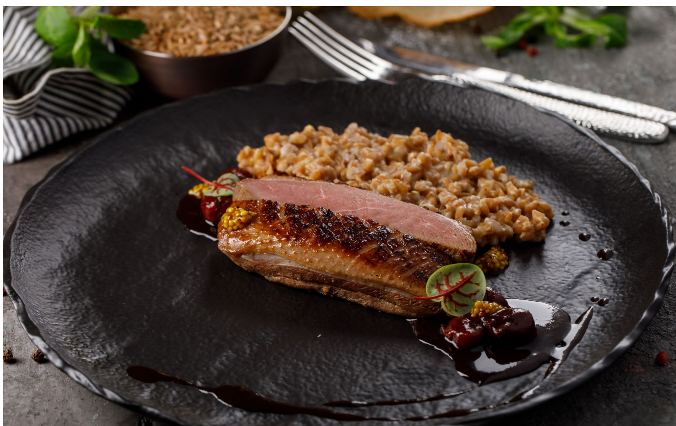
УТИНАЯ ГРУДКА С ПОЛБОЙ И ВИШНЕЙ