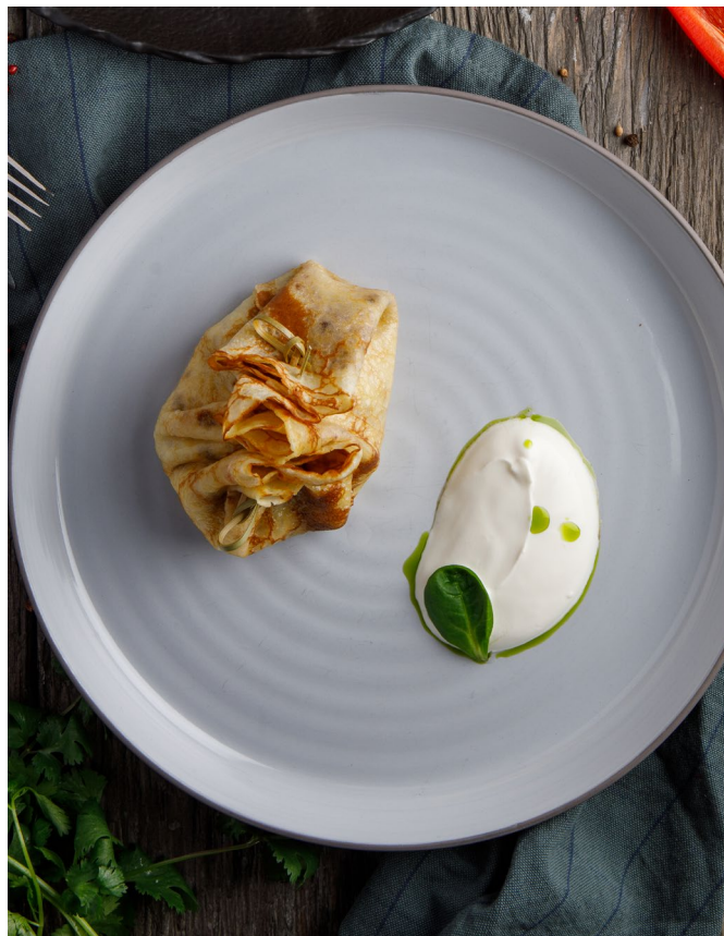
БЛИН | PANCAKES С ТЕЛЯТИНОЙ | WITH VEAL | 650 ₺