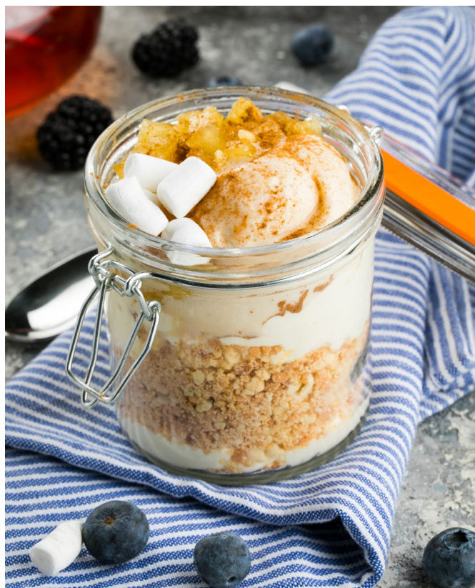
ПЕЧЕНОЕ ЯБЛОКО С КАРАМЕЛЬЮ И ВАФЛЕЙ