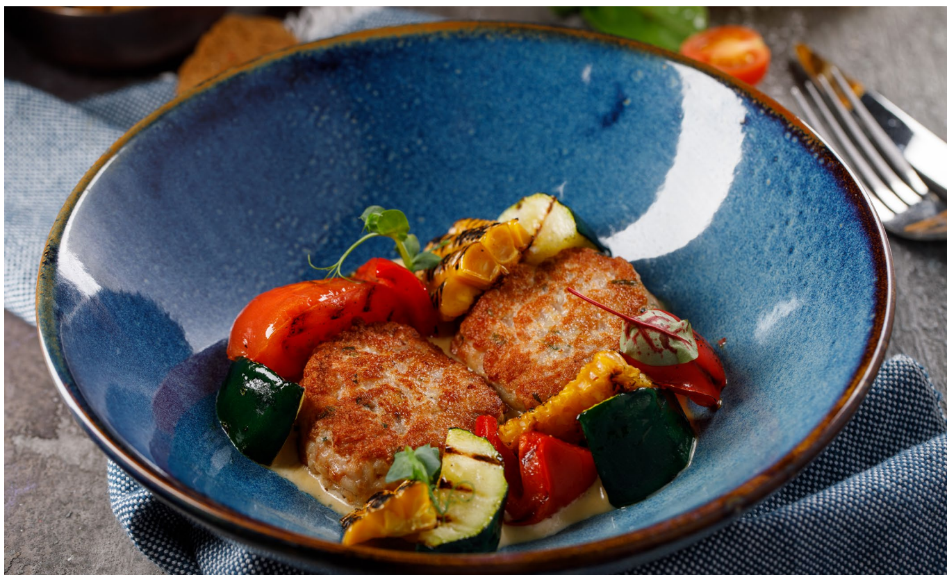
КУРИНАЯ КОТЛЕТА С ОВОЩАМИ НА УГЛЯХ можно приготовить на пару

CHICKEN RISSOLE WITH CHARRED VEGETABLES steam cooking available