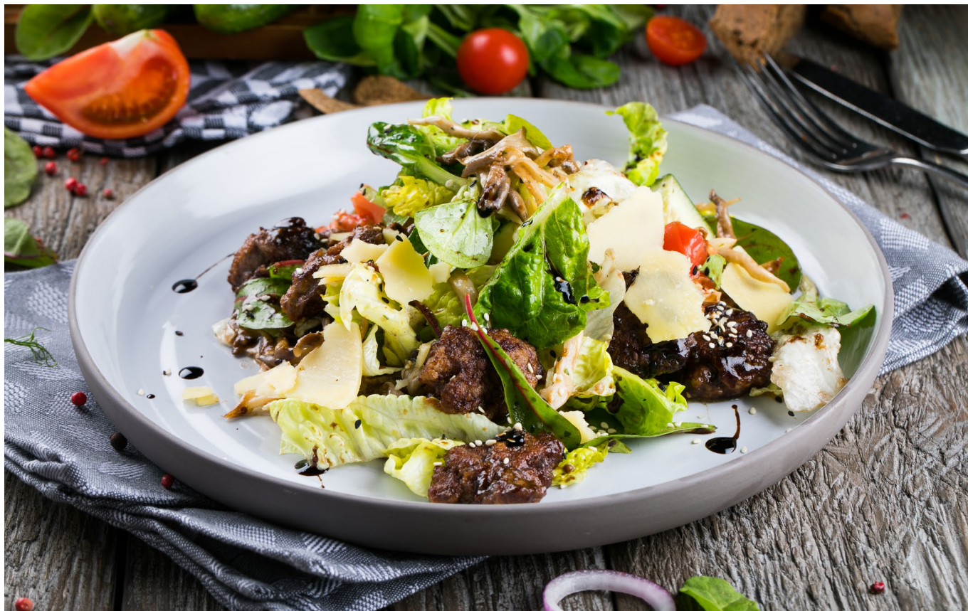
ТЕПЛЫЙ САЛАТ С КУРИНОЙ ПЕЧЕНЬЮ