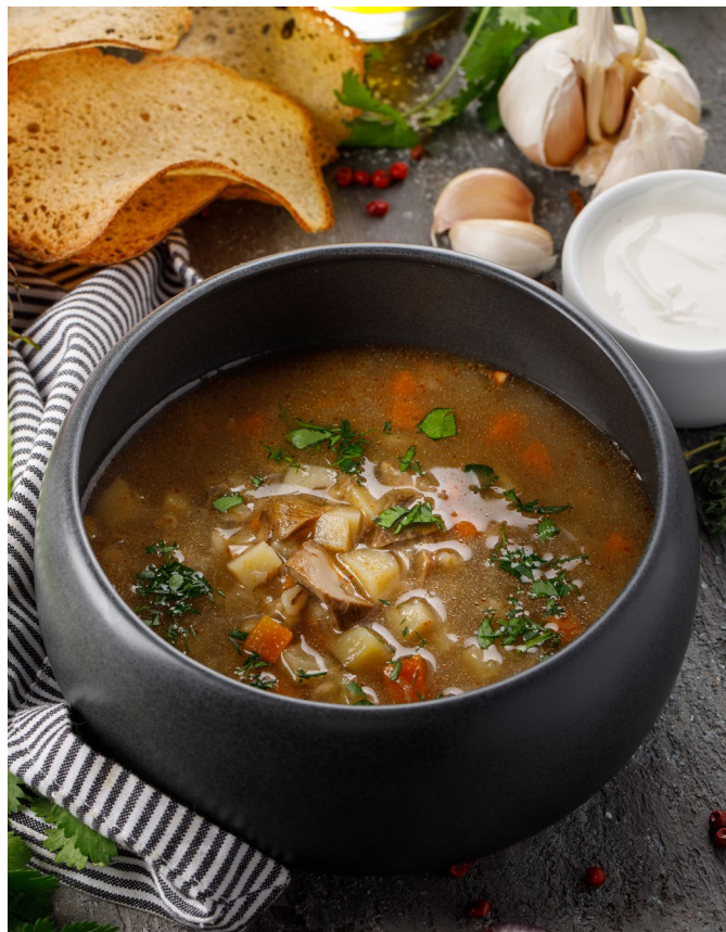
СУП ИЗ БЕЛЫХ ГРИБОВ