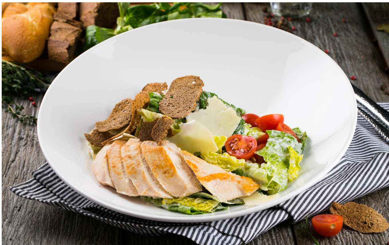
ЦЕЗАРЬ С КУРИНОЙ ГРУДКОЙ