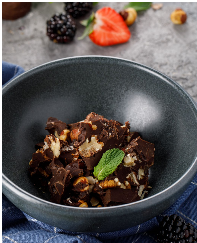
ДОМАШНИЙ ШОКОЛАД С ОРЕХАМИ