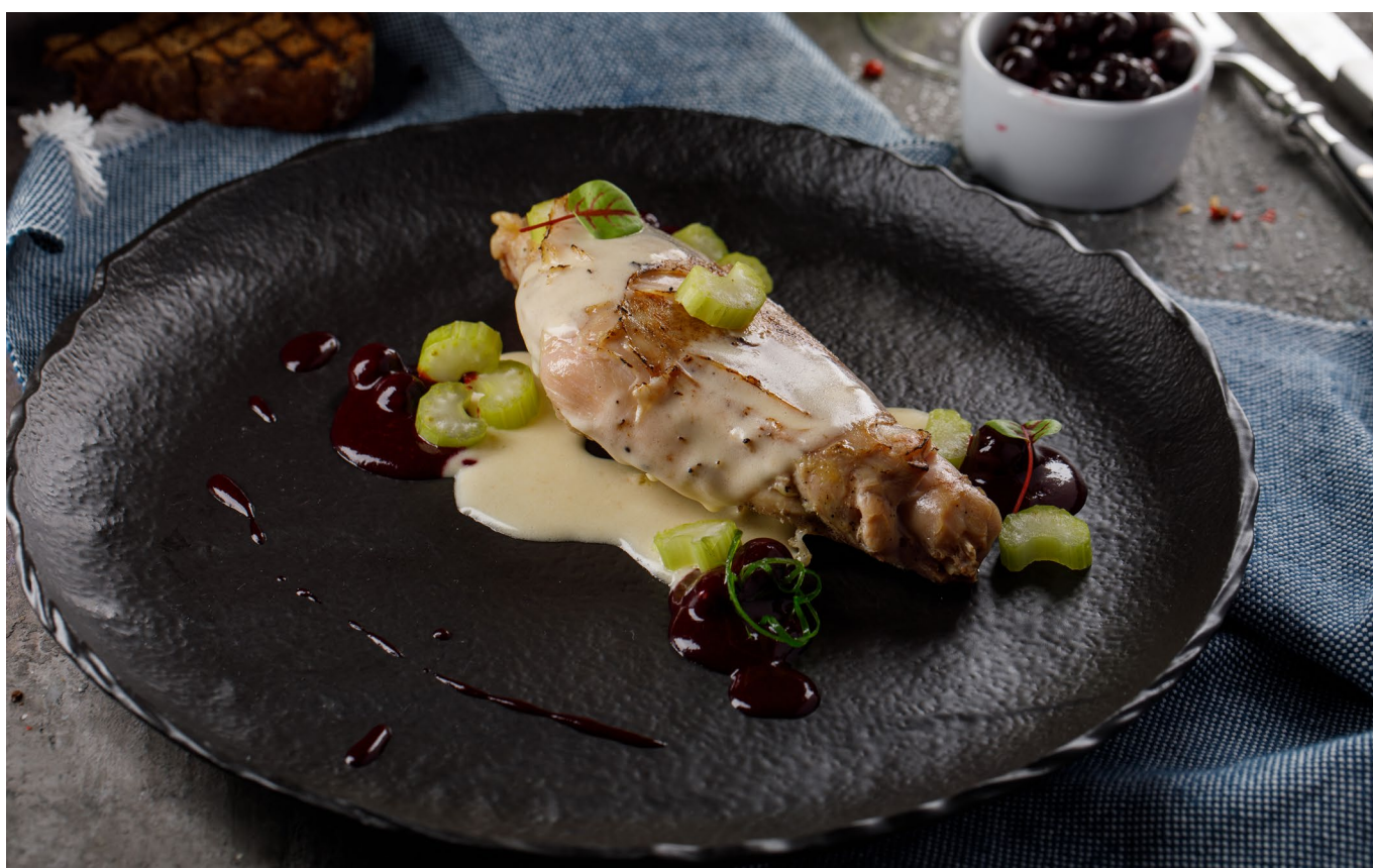
ТОМЛЕНАЯ НОЖКА КРОЛИКА С ЧЕРНОЙ СМОРОДИНОЙ