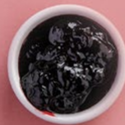
Варенье из жимолости 350 р.