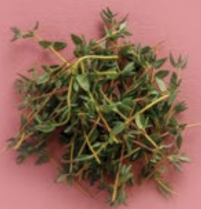
Чабрец 100 р.