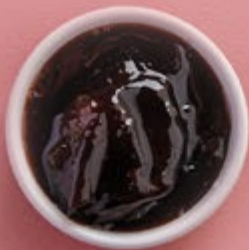
Варенье из сливы 200 р.