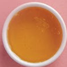
Мед донниковый 450 р. подходит для зеленых чаев, улунов.