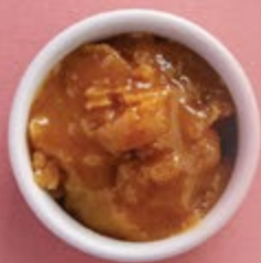
Мед гречишный 450 р. подходит для черных чаев, пуэров, пряных чаев.