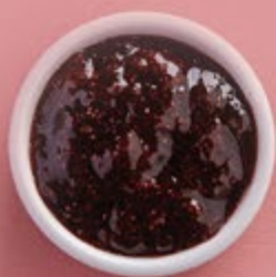
Варенье из земляники 500 р.