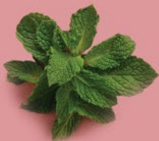
Мята 100 р.