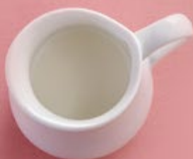
Молоко 100 р.