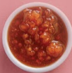
Варенье из морозики 500 р.