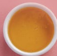
Мед липовый 450 р. подходит для травяных, фруктовых и классических черных чаев.