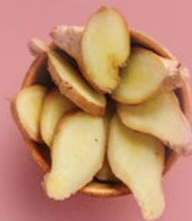
Имбирь 200 р.