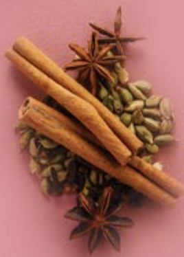
Специи 200 р.