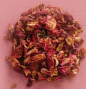
Лепестки роз 100 р.